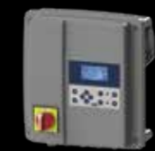
Boîtier de commande interactif SMART

Références : SANIFOS® 1300 Triphasée Vortex EAN 3308815077819 SANIFOS1300VORTEXTRI