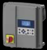
Boîtier de commande interactif SMART

Références : SANIFOS® 1300 Monophasée dilacération EAN 3308815077796 SANIFOS1300 SANIFOS® 1300 Monophasée Vortex EAN 3308815077802 SANIFOS1300VORTEX