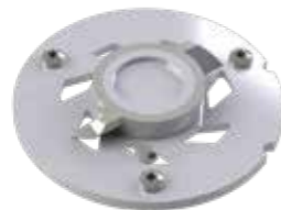
Couteau ProX K2

Livrée avec son boîtier SMART : système interactif et intelligent de surveillance de la station.