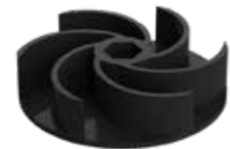
Système roue Vortex KX V6